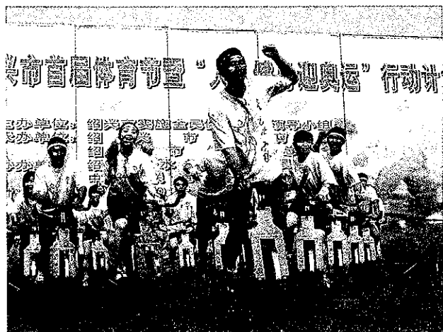
绍兴市首届体育节健身专场表演