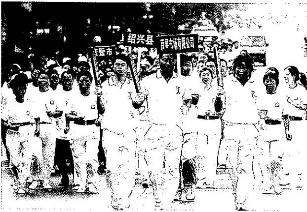
省运圣火接力传递活动

【浙江省第三届嗒嗒球比赛在绍兴举行】 12月1日至3日,“嗒嗒乐杯”浙江省第三届嗒嗒球比赛在绍兴举行,来自全省11个市的近300名运动员参加了此次比赛。比赛分为小学生组、中学生组、大学生组、公务员组、乡镇组、企业组和社区组。在为期3天的比赛中,运动员们充分展现了嗒嗒球运动的魅力。绍兴队夺得小学组混合团体、女子单打以及大学组混合团体、女子单打的冠军。(王荣军)