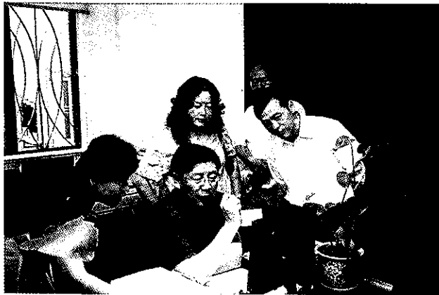
劳动保障部副部长胡晓义(左二)到绍兴调研新型农村合作医疗工作

【概况】 2006年,全市的新型农村合作医疗工作继续稳步推进,各县(市、区)合作医疗筹资工作顺利,基金运行情况比较平稳,合作医疗制度逐步完善,已呈现规范化、科学化发展的良好趋势。人口覆盖面继续扩大,全市3185382人参加合作医疗,占应参加人口的91.64%,行政村覆盖面达到100%。(陈黎明)