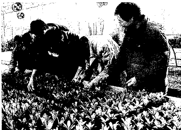
绍兴县园艺学校现代农业省级实训基地

级实训基地 4 个、省级实训基地 17 个,省级示范专业 33 个,省级公共实训基地 2 个,占全省的 14% 左右。 (王 莉)