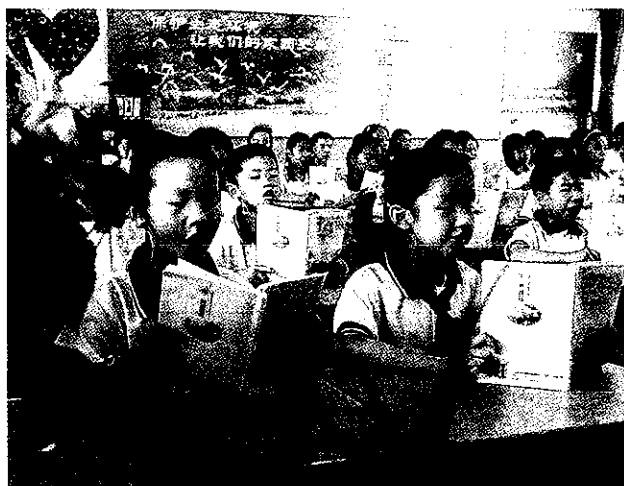
北海小学教育集团活泼生动的课堂教学

【城乡教育共同体建设初具规模】 绍兴市积极探索城区优质教育资源向农村延伸,以城带乡,以强扶弱,通过名校输出品牌、办学理念、管理方式、优质师资,促进名校高效益运作,新校高标准起步,弱校新平台发展。年内,一中初中部与新建成的农村学校——镜湖中学组建为绍兴市第一初级中学教育集团。诸暨市组建浣江教育集团并启动实施“城乡互助、镇域一体”共同体建设。绍兴县成立鲁迅中学教育集团,设立城南校区和柯桥校区。越城区龙洲双语实验小学整体并入北海小学教育集团,树人小学南校区委托鲁迅小学教育集团实行“团队契约式管理”。(顾益明)