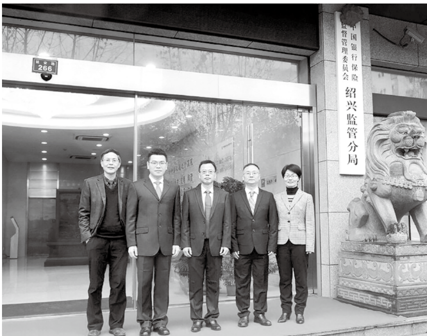
中国银保监会绍兴监管分局挂牌。

工商银行绍兴分行发展普惠金融,成立普惠金融业务部,向总行申请上报批准设立 7 家普惠专营支行。创新融资产品。至年末共为 23 户企业定制“工银聚”产品,为 261 户企业开立票据池功能。农业银行绍兴分行年末不良贷款率