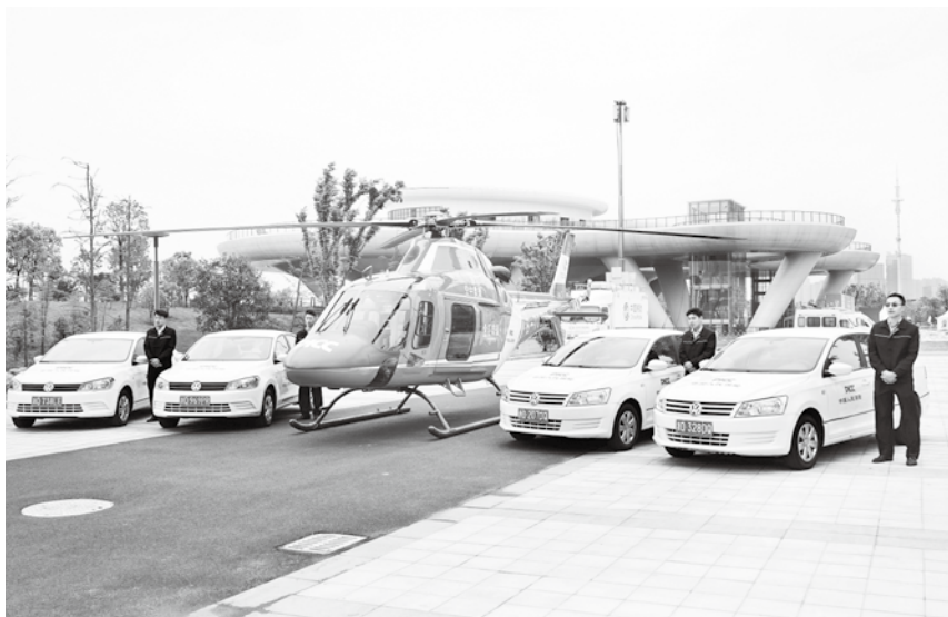
中国人民财产保险股份有限公司绍兴市分公司推出直升机救援,实施空地一体服务。(市保险协会提供)

【财产险公司业务】 2018年,绍兴市财产险公司保费收入63.6亿元,增长7.57%。其中,车险保费收入50.28亿元,增长4.87%;非车险保费收入13.32亿元(其中企财险保费收入3.96亿元),增长19.14%。全市财产险公司赔付支出37.18亿元,赔付率为58.46%。其中,车险赔款支出30.79亿元,增长8.3%,赔付率为61.23%;非车险赔付支出6.39亿元,增长25.42%,赔付率为48%。全市实现承保利润10215.36万元,其中车险盈利4576.5万元