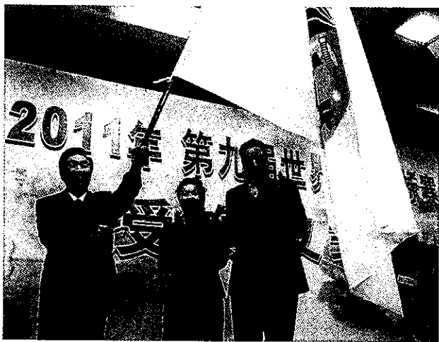
世界合球锦标赛授旗仪式

【概况】 2008年,全市体育工作以“奥运年”为契机,围绕市委、市政府中心工作基调,积极奏响“全民健身与奥运同行”主旋律,营造全市“支持奥运、参与奥运、喜迎奥运”浓厚氛围,市体育局组织开展了具有地方特色的8大类100个小项体育系列活动。竞技体育再创佳绩,3名绍兴籍运动员在北京奥运会取得优异成绩;组队参加省青少年17个大项比赛;组织开展了全市青少年24个大项比赛。体育产业不断拓展,引进重大体育赛事10余项,体育彩票销售超过2.60亿元,体育用品制造业有了新拓展。体育设施规划与建设进一步加快,市奥体中心、绍兴中国皮划赛艇训练基地的选址已经确定,并列省重点建设工程和市重大项目;市水上体育公园一期工程进展顺利,主体结构于年底顺利完工。(王荣军)