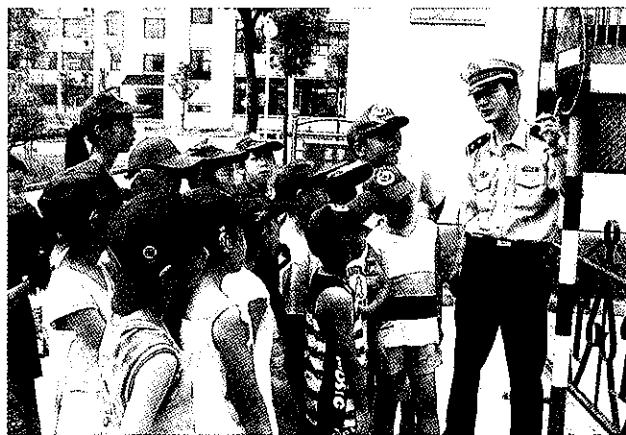
中小学生学习交通安全宣传月活动

【开展中小学交通安全宣传月活动】10月,市教育局会同公安部门联合开展以“七个一”为主要内容的中小学生学习交通安全宣传月活动,即每县(市、区)建立一个交通安全宣传教育模拟基地、上好一堂交通安全课、给小学生发放一套交通安全书签和《平安伴你成长》动漫手册、给中小学教师发放一本《浙江省〈交通安全法〉实施办法》读本、张贴一套交通安全挂图、举行一次交通安全教育优质课评比活动、组织全市中学生开展一次交通安全演讲比赛等。(徐善斌)