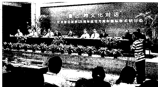
“鲁迅·跨文化对话”国际学术研讨会

【“风则江大讲堂”举行专题讲座52场】自2005年10月18日“风则江大讲堂”开讲以来,已举行专题讲座52场,有近3万人次聆听演讲报告;4万余人次观看了视频直播,视频点播超过2.5万人次。新华网、《浙江日报》等媒体对此给予了充分肯定和积极评价的报道,在社会上引起良好反响,成为浙江省高校校园文化建设和绍兴文化强市建设中的一大品牌。《风则江大讲堂(第一辑)》演讲文集已由中国社会科学出版社出版。(刘 敏)