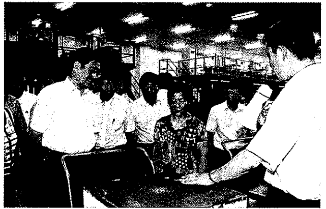
市人大常委会视察工业创新工作

8月19日,市人大常委会对全市工业创新发展工作情况视察。实地察看浙江精功科技股份有限公司、精功绍兴太阳能技术有限公司和浙江恒业成有机硅有限公司,听取有关情况汇报,并将视察和调研情况提请常委会审议。