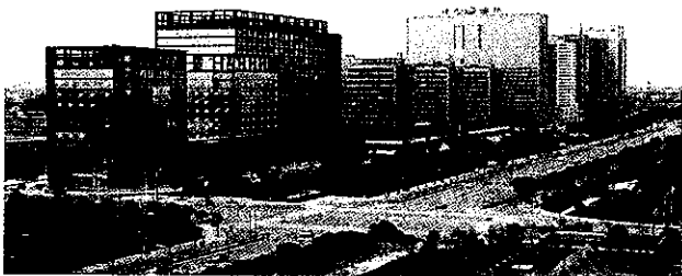
中国轻纺城国际商贸区

【荣获“中国曲艺之乡”和“中国书法之乡”称号】 年内,广泛开展农民“种文化”活动,承办第五届中国曲艺牡丹奖全国曲艺大赛(绍兴赛区),承办 2008 年全国青少年无线电通讯锦标赛,开展绍兴莲花落诞辰百年系列庆祝活动和“越剧天天演”活动。开展第三次全国文物普查和县第二次非物质文化遗产普查。县博物馆、图书馆免费向公众开放。启动有线电视数字化改造。举行