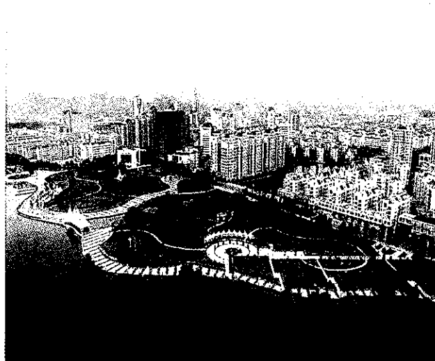
新县城一角

【被命名为国家园林县城】2月13日,建设部命名 2007 年国家园林县城和国家园林城镇,命名北京市密云县等 20 个县城为 2007 年国家园林县城。绍兴县被命名为国家园林县城。(杨红玉)