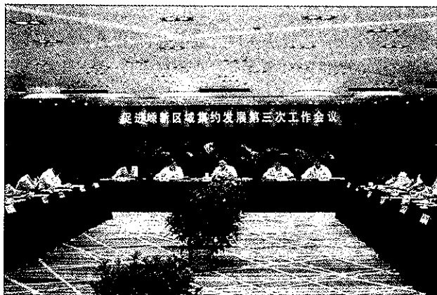
嵊州新集约发展第三次工作会议

【新认定省级及以上高新技术企业和科技型企业 35 家】全年财政对科技投入 5705 万元，比 2007 年增长 31.70%。新建绍兴市级以上研发中心和高校技术转移中心 14 家，创建国家级天乐集团博士后科研工作站，市科技创业中心成为“省级综合性科技企业孵化器”，新认定省级及以上高新技术企业、科技型企业 35 家。专利授权量 639 件，被认定为“省知识产权示范创建市”。起草制订国家标准 11 只、行业标准 10 只，首批 21 家企业使用“嵊州领带”省级区域名牌，被授予“中国小功率电机生产基地”称号。全市在建个私工业集聚区 68 个，完成固定资产投资 4 亿多元，入区个私企业 550 多家。（支浩权）