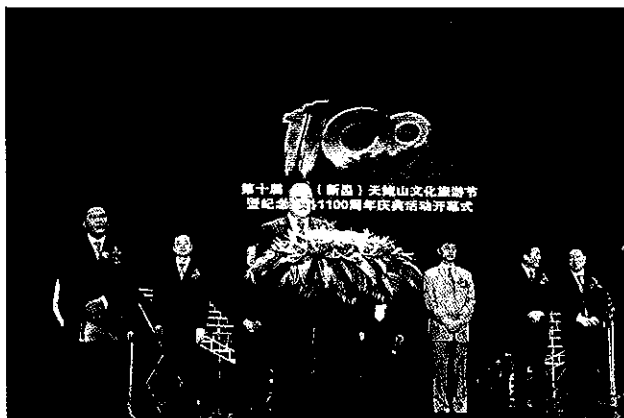
第十届中国(新昌)天姥山文化旅游节开幕式

【第10届中国(新昌)天姥山文化旅游节】10月19日至25日,为纪念改革开放30周年和新昌建县