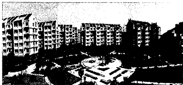
塘南组团湾湖公寓(越城区政府办公室提供)

【投入改进农村环境卫生环境资金8016万元】年内,出台《关于推进城乡环卫一体化工作的实施意见》,专门设立镇级环境卫生调节基金,投入资金8016万元,清除陈年垃圾2万余吨,河道清淤26万立方米、砌坎2.70万米,硬化村道23.80万平方米,全年有76个村通过村庄垃圾“除旧清新”验收。在鉴湖镇试行村庄环境卫生市场化专业保洁,对试行市场化保洁村按保洁协议金额的40%比例给予补贴,全区有25个村采用市场化专业保洁。建立城乡环卫一体化工作督查考核小组,将农村环卫工作列入镇、村年度岗位目标责任制考核,城乡环卫一体化管理体制和管理网络不断健全。(越城区政府办公室提供)