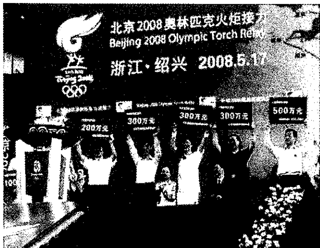
绍兴企业界在北京奥运圣火传递仪式上向地震灾区捐款

【为汶川地震灾区捐款 51453.02 万元】 “5·12”汶川特大地震发生后,市慈善总会在第一时间启动紧急预案,发出倡议书,倡导社会各界踊跃捐款、奉献爱心,共接收赈灾捐款 2518.98 万元(含利息 60696.20 元)。根据市政府和上级部门统一部署,所收捐款分 12 批次拨付地震灾区,用于购买救灾物资和灾后恢复重建。11 月份,市慈善总会又组织开展“送温暖、献爱心——向汶川地震灾区捐赠衣被活动”,共接收捐款 48945 元,已全部用于为地震灾区购买冬衣被。全市共有 587 个单位和个人分别被省慈善总会授予“慈善突出贡献奖”、“慈善贡献奖”和“慈善爱心奖”。(任建亚)