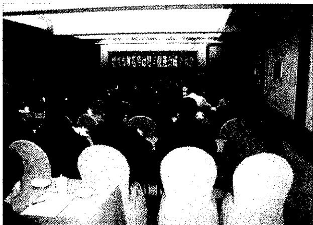
12月8日,绍兴市规范用工促进会成立

【概况】 2008年,全市劳动保障部门坚持实施积极的就业政策,以创业带动就业,积极推进统筹城乡的就业促进体系建设。全市城镇新增就业人数72758人,完成全年目标的124%;其中市区19077人,完成全年目标的141%。全市城镇失业人员实现再就业34383人,完成全年目标的151%;其中市区11622人,完成全年目标的182%。全市就业困难人员实现再就业6952人,完成全年目标的129%;其中市区1822人,完成全年目标的126%。全市城镇登记失业率为3.45%,市区为3.46%。全市就业形势保持稳定。全市现有失业保险参保单位31498家,市区9195家;失业保险参保人数647844人,市区172865人;征缴基金28141.47万元,其中市区11417.12万元。全市失业保险基金累计结余67258.46万元,市区25535.42万元,创历史新高。全市共有58815人(次)领取失业保险金,其中市区26035人(次);支付各项失业保险费用4841.91万元,其中市区2235万元。(许晓艳)