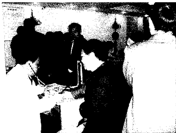
稽山街道对退休人员实施体检

【实行社会化管理退休人数达 110461 人】年内，市劳动保障局继续推进企业退休人员社会化管理服务工作，共接收退休人员档案移交 1898 人，累计接收移交 9038 人。至年底，全市实行社会化管理人数达 110461 人，社会化管理服务率达 99.46%，其中社区管理人数为 100071 人，社区管理率达 90.10%；市本级社会化管理人数为 42780 人，社会化管理服务率达 100%，其中社区管理人数为 40764 人，社区管理率达 95.28%。（许晓艳）