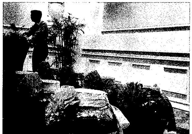
黄酒原酒拍卖

【“古越龙山”原酒交易正式启动】3月5日，绍兴古越龙山原酒经营有限公司成立暨世纪原酒展卖会在中国黄酒博物馆举行，这标志着古越龙山原酒交易正式启动。原酒交易是黄酒销售的一种新的模式，“古越龙山”储存着24万吨陈年黄酒，各种年份酒十分完善，各种档次的酒品种齐全，在黄酒行业中独一无二。古越龙山原酒公司利用巨大的中央酒仓库和黄酒博物馆地下酒库两个实地平台，通过建原酒交易网站，为企业和个人搭建集现货交易、期货交易、个人收藏及投资在内的原酒交易平台。大会在公布原酒交易的细则以及供应的各年份酒数量及价格后，有68坛世纪原酒参与了展卖。最后这68坛世纪原酒卖出94万元，创下黄酒陈年酒价格之最。(陈 锤)