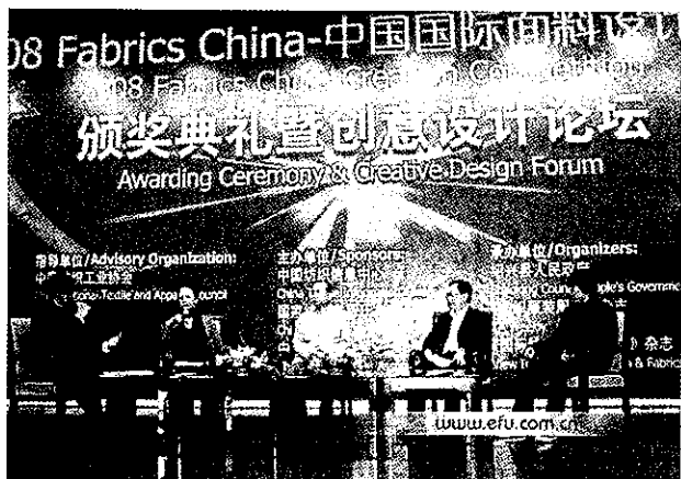
2008年中国国际面料设计大赛颁奖典礼暨创意设计论坛

【举办中国国际面料设计大赛】 10月25日,“2008年中国国际面料设计大赛颁奖典礼暨创意设计论坛”在柯桥举行。本次大赛由中国纺织信息中心、国家纺织产品开发中心和流行色协会主办,绍兴县政府、《国际纺织品流行趋势》和《纺织服装周刊》共同承办,是国内最具权威性和影响力的纺织产品设计大赛。柯桥作为国内最大的纺织品集散中心,首次举办本次大赛。绍兴市4家企业榜上有名:浙江德龙莎美特针纺有限公司设计的《灰色梦想》、绍兴县丽帛仁纺织品有限公司设计的《流动的金属》和达利丝绸(浙江)有限公司设计的《奇光眩影》等产品获得了面料组优秀奖。浙江彩虹庄印染有限公司荣获了大赛为鼓励产业集群地企业产品开发工作而特别设置的单项奖。(陈 锤)