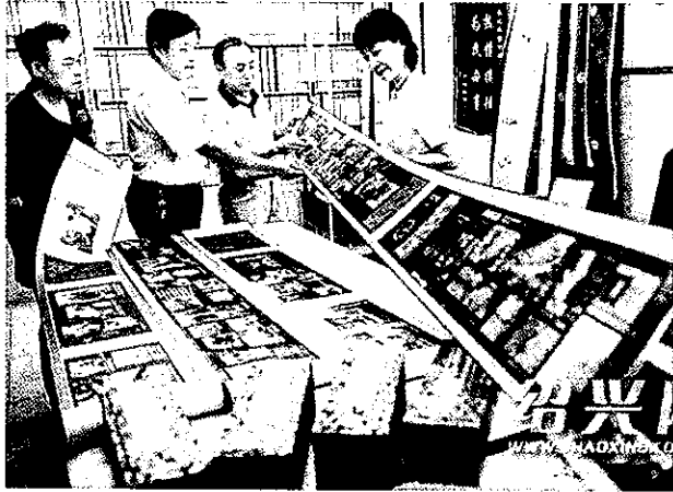
永通纪念汶川特大地震丝绸长卷

建家园,青山不老、军魂长存,川浙连心、共建家园”的史实织入绸缎,展现了党和国家领导人亲临地震第一线,指导抗震救灾的动人场面。这两幅丝绸长卷是永通集团利用自身技术优势,投资100多万元,花1个月时间精心制作而成。(陈 锤)