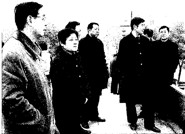
市人大常委会领导视察城建重点工作

市区段建设工程、城南沁雨苑经济适用房建设工程、书圣故里2号街坊保护工程、解放北路延伸工程和镜湖新区一期路网中三号桥建设工地,听取有关情况汇报,并将视察和调研情况提请常委会审议。