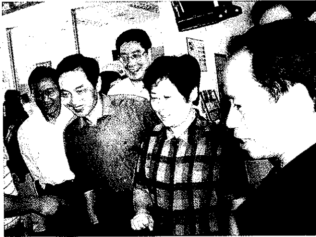
市人大常委会视察社会福利和救助工作

10月18日，市人大常委会对全市社会主义新农村建设情况进行视察。实地察看越城区戴山街道戴山村、绍兴县柯岩街道河塔村、绍兴县钱清镇梅东村和绍兴县夏履镇生态农庄，听取有关情况汇报，并将视察和调研情况提请常委会审议。