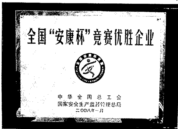
中成集团获“全国‘安康杯’竞赛优胜企业”称号(市志办提供)

【概况】 2008年,全市共办理工程报建61个,工程总投资额12.20亿元,开具施工许可证54份,开工建筑面积69万平方米,工程报建率达100%;办理监理合同备案53只;完成项目经理诚信手册年检603人次,其中新办、升级36人次;办理涉及勘察设计、工程质量等方面的一般程序案件10件,其中涉及无证施工5起、涉及安全技术规范2起、涉及肢解分包1起、违反工程建设强制性标准1起。在全市建筑企业中,被评为全国“安康杯”优胜企业1家,评为浙江省“安康杯”优胜企业5家,评为浙江省“安康杯”优胜班组(项目部)6个,评为浙江省现场文明和谐建筑工地9个,荣获“市级文明工地”称号22个。另有1家企业获“市级示范工会”、2家企业获“市级先进职工之家”称号。(市建管局办公室提供)