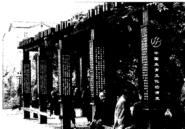
省级生育文化园区——越城区罗门公园

【创建市级生育文化特色镇(村)118个】 全年继续开展生育特色镇村(街道)创建活动,抓好人口文化广场、人口文化主题公园、规模型生育文化园区建设,加强对计划生育宣传长廊、宣传一条街、咨询服务室等宣传阵地建设,启动农民计划生育/生殖健康知识培训工程,完成《绍兴市农村人口计生知识读本》编写,并落实培训方案和师资。至年底,绍兴县夏履镇人口·生育文化广场、越城区罗门公园生育文化园区、嵊州市马寅初故居生育文化园区被省委宣传部、省人口计生委命名为省级生育文化园区;全市有18个乡镇街道、100个村创建成第二批市级生育文化特色镇(村)。(陈莉芳)