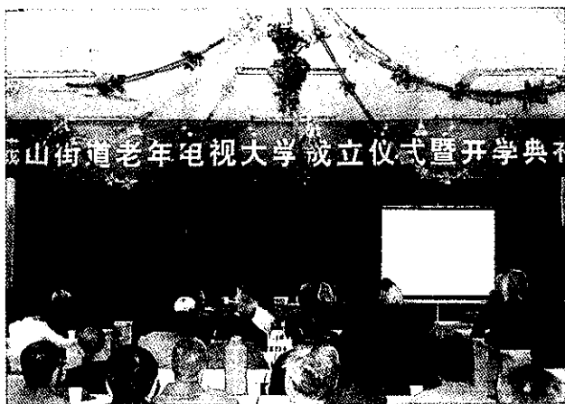
嵛山街道老年电视大学成立暨开学典礼

【全市老年电大招生增幅居全省首位】 年内,建立由市老龄办、民政局、劳动保障局、教育局、财政局、文广局、人事局、总工会、广电总台九部门组成的浙江老年电视大学绍兴分校校务委员会,经市政府批准下发《转发市老龄办等部门关于加强老年电大教育工作意见的通知》,明确规定各地老年电大招生指标,提出加大财政补助、学费报销、列入对乡镇街道的考核、建立通报制度等措施。市老龄办多次分赴各地,进行督查与协商落实,从而确保老年电大秋季招生各县(市、区)全部达标,全市共招生3.30万人次,居全省前三位;增幅达106.20%,居全省首位。(赵云牛)